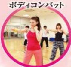
ボディコンバット